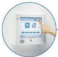
ホームコントローラー