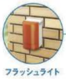
フラッシュライト