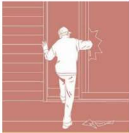
外出・在宅時の防犯