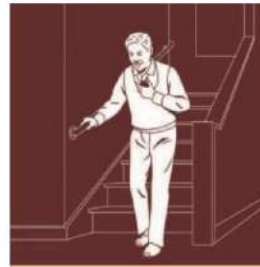
救急通報サービス

急病時などには、ペンダント型の「マイドクター」を握るだけで、救急信号をセコムに送信できます。