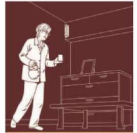
安否見守りサービス

急病時などには、ペンダント型の「マイドクター」を握るだけで、救急信号をセコムに送信できます。